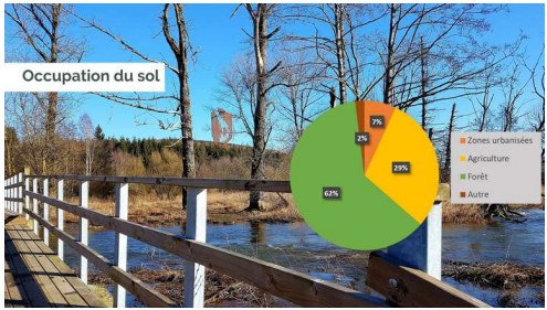
Occupation du sol

Plateaux et vallées encaissées, Ourthe, PINDO, CRO, etc.